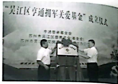
图5 2018年, 亨通设立“亨通拥军关爱基金”, 开始帮扶伤残贫困退役军人