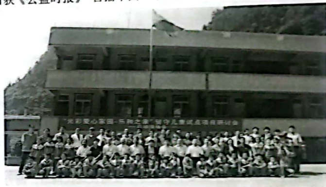
图7 2013年, 崔根良捐赠善款, 积极参与中国光彩会发起的“光彩爱心家园——乐和之家”重庆项目, 帮助留守失学儿童重返校园

精准扶贫关键是面向贫困地区、贫困人口。当崔根良得知曾经的红色根据地——江西革命老区孤寡贫困老人生活条件十分艰苦, 便从2012年起, 积极助力国家脱贫攻坚战略, 在民政部支持下开展“鹤轩安耆工程”, 连续五年帮扶井冈山、吉安、遂川、兴国、宁都等贫困县区, 改造25家敬老院, 捐助26辆多功能救护车, 极大改善了养老院设施条件, 受益老人超2000人, 该项目获《公益时报》“善播中国”年度示范项目。