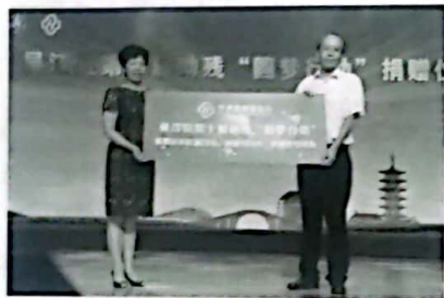
图4 亨通连续11年实施“助残圆梦行动”项目, 捐物捐款帮助贫困残疾人家庭