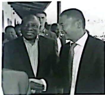
图14 2019年1月10日，南非总统拉马福萨总统视察亨通集团南非Aberdare公司公益项目AberSchool，图为公司总经理与总统握手交流

南非有一项BEE法案，对每个企业都要做BEE积分卡评级，这似乎对企业经营自主权有所限制，但如果站在政府角度换位思考，就能正确对待。亨通南非公司在三年内评到最高的“第一等级”，南非所有外国投资企业中能评到这个等级的不到10%。公司最终成为当地履行BEE法案的示范企业，受到南非两任总统的肯定。