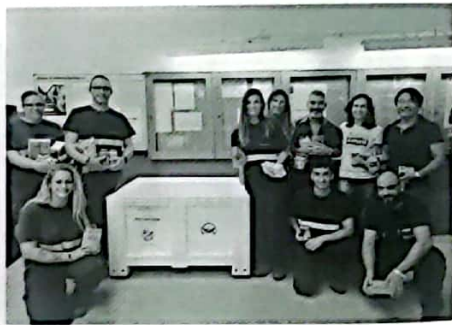
图15 亨通西班牙CABLESCOM公司联合萨拉戈萨食物赈济处开展食品收集活动，免费捐赠给萨拉戈萨的一些养老院

在西班牙，亨通西班牙公司积极资助当地教育，向养老院捐赠食品等物资；在印尼，亨通印尼公司积极向周边社区捐赠，并积极举办义务献血等活动，彰显了中国企业在海外的良好形象。